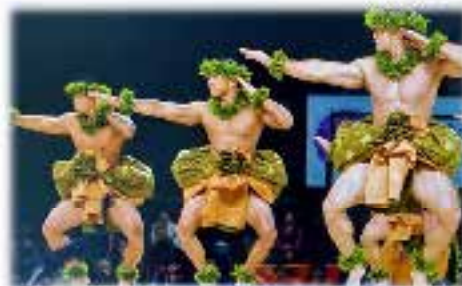
Ke Kai O Kahiki