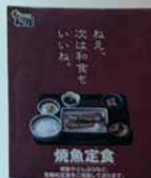
2001年 和定食「焼魚定食」チラシ