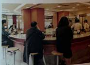
和定食の松屋店内(2001年)

価格設定やメニュー開発といった会社にはできない「大きなサービス」、そして最前線の店舗でしかない「小さなサービス」を組み合わせ、インパクトのある顧客満足を生み出すことこそ松屋ブランドの礎となると考えていました。