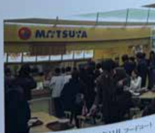
青島(チキン)ジャスコ店(2004年11月、フードコート内)に開店