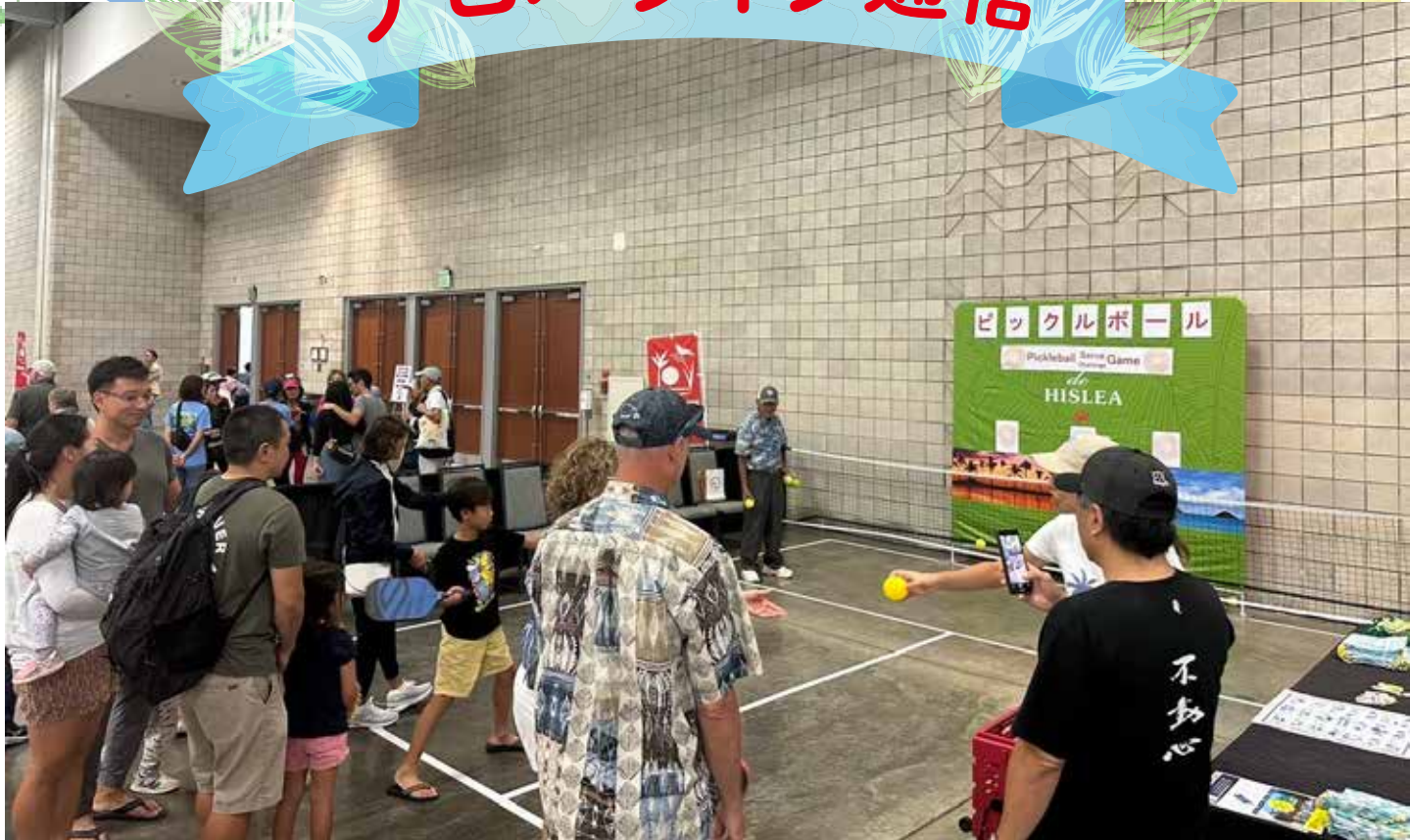
ホノルルフェスティバルのハレの会ブースは今年も大盛況! 習字や麻雀、ピククルボール体験、太鼓演奏など、ローカルに大人気だった。(中面にも記事)