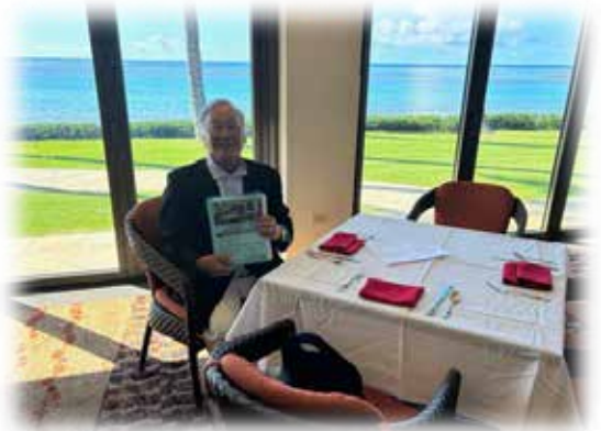
セミナー会場のWaialae Country Club Meeting Room

場所: Waialae Country Club 参加費: ランチ付き $25(定員15名) 当協会法人会員の方は参加費無料です。 参加申込: アロハオフィス (808) 428-5808 または協会ウェブサイト https://hawaiialohalife.org または裏面の申込書に必要事項を ご記入ください。 申込締切: 定員になりましたら締切となります。