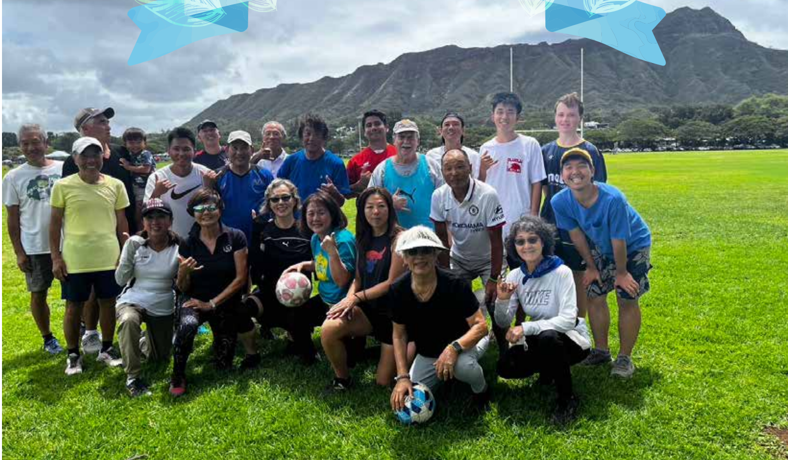
毎週土曜日にカピオラニ公園で開催しているイベント「ウォーキングサッカー」でのひとコマ。最近では若手世代の参加も多くなってきた。