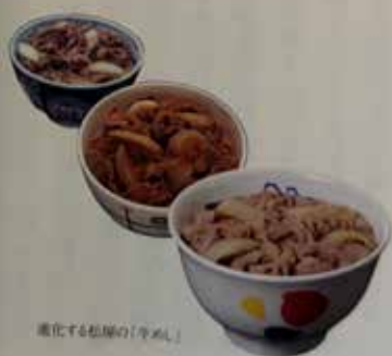
進化する松屋の「牛めし」

食卓でご飯を食べることが人生の幸せの原点ではないでしょうか。そのための食や食卓を提供すること、みんなの食卓であり続けること。それが、私にとつての幸せなのかもしれません。私たちの事業は創造業、形にしたい「食卓」がまだまだたくさんあります。ご縁と仕事に恵まれて82歳、新しい食卓づくりはまだまだやめられません。