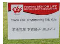
※Tee Groundスポンサー (イメージ)

Tee Groundスポンサー: 申し込む $100×( )口=$ _____ 申し込まない