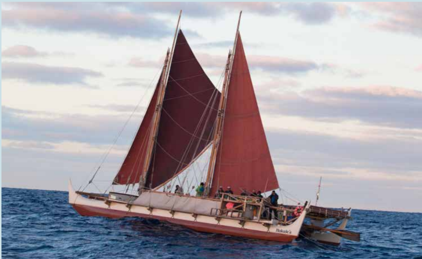
ホクレア

アロハ! ハワイは久しぶりに雨が降り、茶色になっていた山々に、やや緑が戻りつつあります。6月の末には、ワイキキのカイマナビーチでモンクシールの赤ちゃんが生まれ、その微笑ましい姿で、しばらくの間、人々を楽しませてくれました。カイマナと名付けられた赤ちゃんは既に母親のロッキーから自立し、より安全なビーチに移動し、順調に育っているようです。既に遊び友達も見つけ、ビーチで戯れる姿が、時々報道されます。モンクシールは絶滅危惧種に指定されていますが、地道な保護活動により、少しずつ数が増えています。6月に世界航海を終えてハワイに戻ってきた、伝統航法によるハワイアンカヌーの「ホクレア」も、しばしの休息と修理を終え、ハワイ諸島を回る「マハロ・ハワイ」の航海を始めました。このマハロ航海では、3年間に及んだ世界航海への支援に対する感謝とともに、未来を担う子供達に自然の大切さを教えることも大きな目的としています。「マラマ・ホヌア」、「地球を大切にしよう」というホクレアのスローガンは、世界航海を終えた今、ますます重みを増しているように感じます。