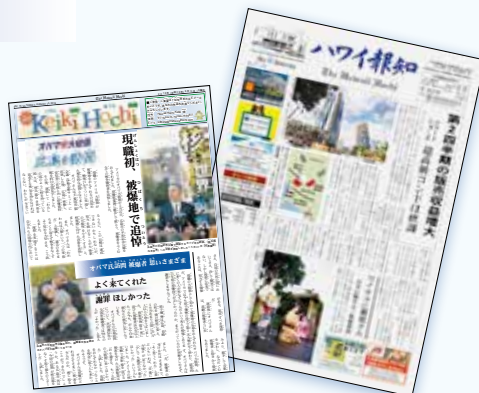
ハワイ報知本紙とKEIKI HOCHI(子供新聞、月2回刊)

購読のお申し込み、お問い合わせは、 subscribe@thehawaiihochi.com 、もしくは、(808)845-2255 までご連絡ください。