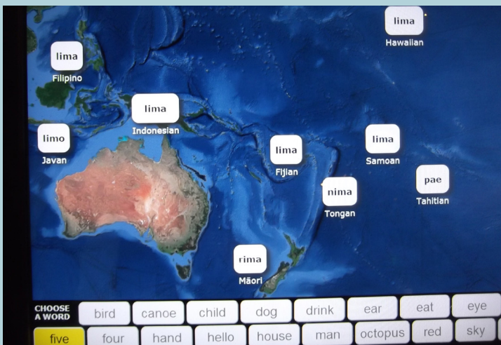
オーストロネシア語族の「五」の各地での発音

皆さんはハワイ語の単語を幾つ覚えていますか? 「アロハ」は皆さん全員が知っているでしょう。ハワイ語(オレロ ハワイ)は、ポリネシア語に属し、ポリネシア語はオーストロネシア語族に属します。オーストロネシア語族(諸語)の分布の北限は台湾、東はポリネシア東端のイースター島、南はマオリが住むニュージーランド。西端はマレー系の言語が話されているマダガスカル島まで広がっています。そして台湾原住民の言葉がオーストロネシア語族の一番古い形を残していると考えられています。ビショップ博物館に、オーストロネシア語族に共通する単語を示した展示があります。例えば、数字の「五」をハワイ語では Lima と云うのですが、マレー語でも五はリマと発音します。「飲む」も、広い太平洋の島々で似ています。ところで、ハワイアンの人達はどこから来たのでしょうか? 中国の南部や台湾のあたりから、フィリピンの島々を南下しソロモン群島へ。そこからトンガ、サモアのあたりに移り更に東へ。そしてマルケサスやタヒチから北へ航海して来た人達がハワイに到達したと、現在のポリネシア考古学者は考えています。人々の移動に関する考古学と言語学の説がほぼ一致するのも興味深いところです。